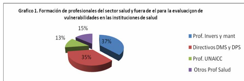
Grafico 1. Formación de profesionales del sector salud y fuera de el para la evaluación de vulnerabilidades en las instituciones de Salud .2008